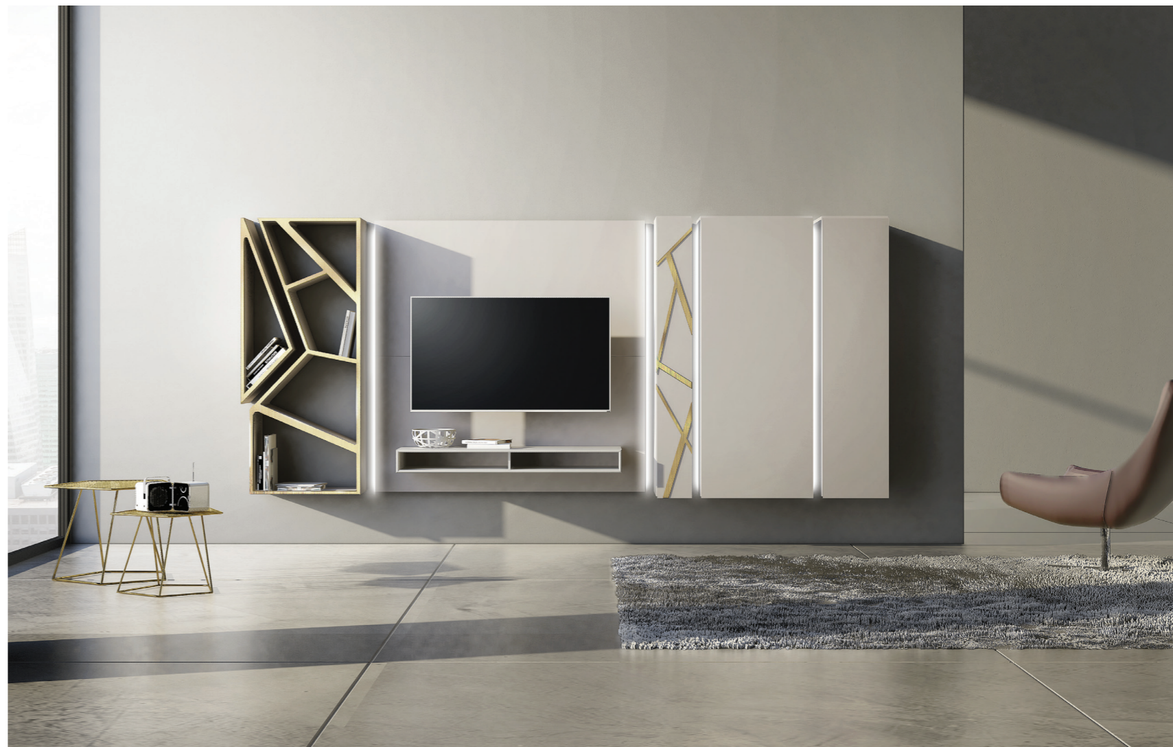
74,7| Composizione I. 345 laccato opaco beige ardenne, bassorilievo 35, bordo frontale libreria bronzo graffiato, con kit luci su gole.