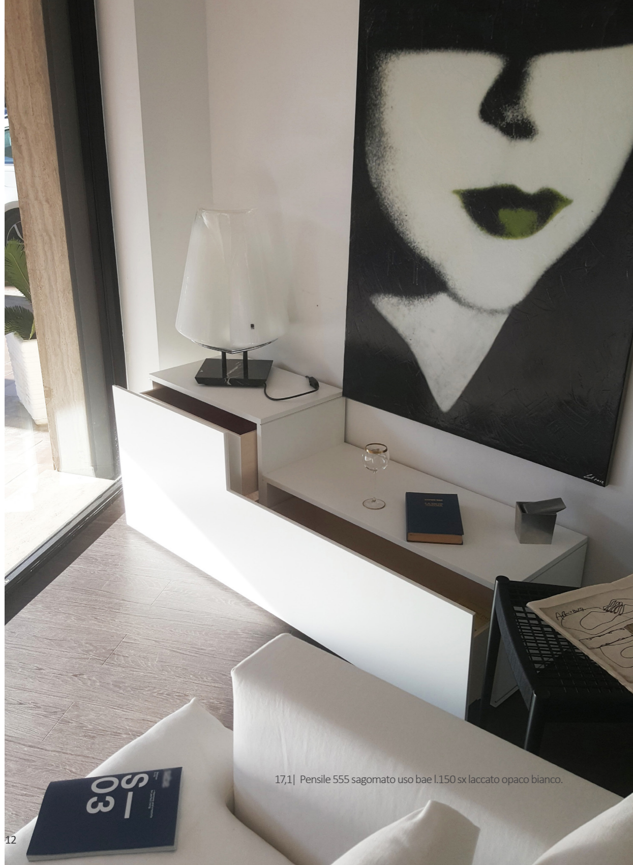
17,1| Pensile 555 sagomato uso bae l.150 sx laccato opaco bianco.