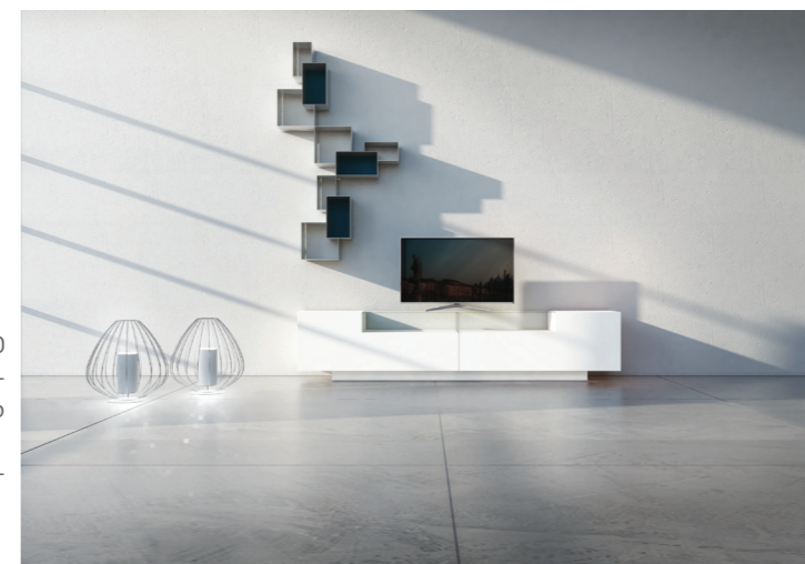
47,5| Madia 555 cm.300 H.75 P.50 Composta da 2 elementi sagomati 150x54,5 laccati opaco bianco con zoccolo e teca in vetro 3,5X3| Librerie young struttura grigio titanio, schiene blu acciaio

La ricerca della luminosità attraverso finiture, materiali e originalità del layout compositivo. Una soluzione nel segno del bianco totale, che rende la luce protagonista dello spazio. Ante laccato gofrato bianco, elementi pensili in metallo.