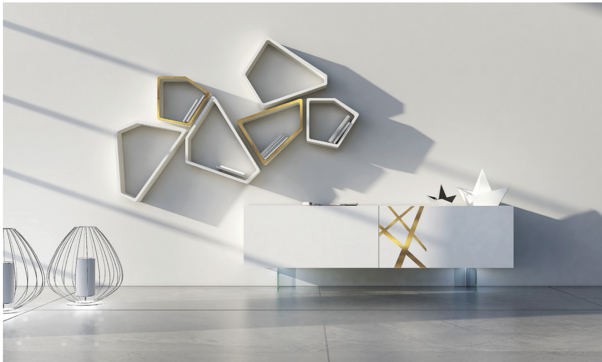
48,7| Madia complanare laccato opaco bianco, bassorilievo 35 parziale l. 240 cm e piedi in vetro. 5,0X4| Librerie space struttura cemento laccato opaco bianco frontale laccato opaco bianco liscio. 7,0X2| Librerie space struttura cemento laccato opaco bianco frontale in bronzo graffiato.