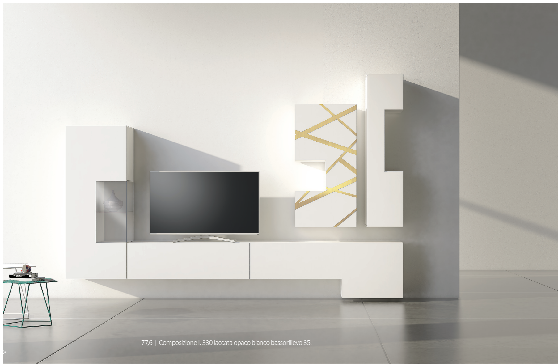
77,6 | Composizione I. 330 laccata opaco bianco bassorilievo 35.