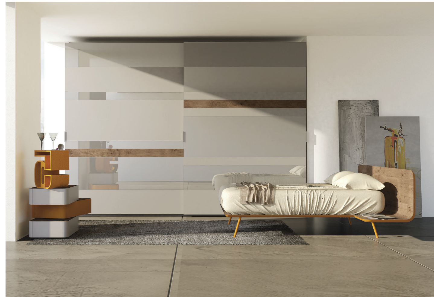
29,4 | Letto No-No quercia con particolari laccato opaco giallo polenta e piedi in metallo verniciato. 81,0 | Armadio Elite l. 362,5 - 2 ante laccato opaco grigio alpaca con inserti quercia, vetri laccato opaco grigio alpaca.