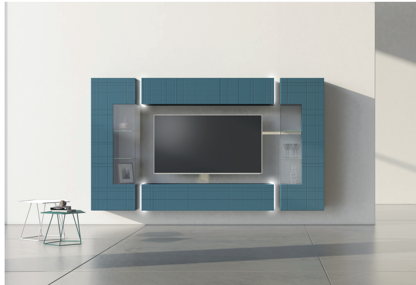
100,0 | Composizione l.316 laccata opaca blu acciaio incisione 34 con kit luci su gole

Il taglio dell'anta della collezione 555 è un punto di forza dell'immagine Voltan, in questo caso con la vetrina angolare. Dettaglio importante è la maniglia ricavata in tutto il perimetro dell'anta che dà un ulteriore dettaglio estetico alla madia. Il mobile, sempre laccato anche internamente, è dotato di cerniere di chiusura con rallentatore integrato. In questa collezione c'è anche la possibilità di applicare allo stesso mobile anche la luce led sui fianchi esaltarne la geometria.