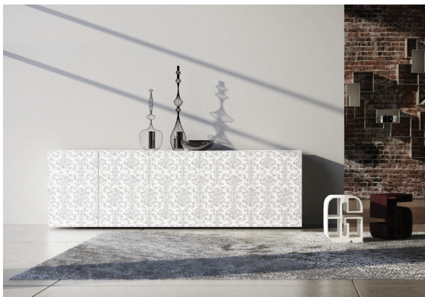
67,5| Madia 555 cm 300 h. 93 p. 50 ante laccate opaco bianco incisione 28.

Le texture dipinte con il bronzo graffiato vestono il legno di un'eleganza senza tempo: tradizione e innovazione si incontrano nel design fatto a mano. Come le pennellate dei quadri d'autore, anche le tracce delle spatole sono diverse a seconda del manufatto, a garanzia della sua unicità.