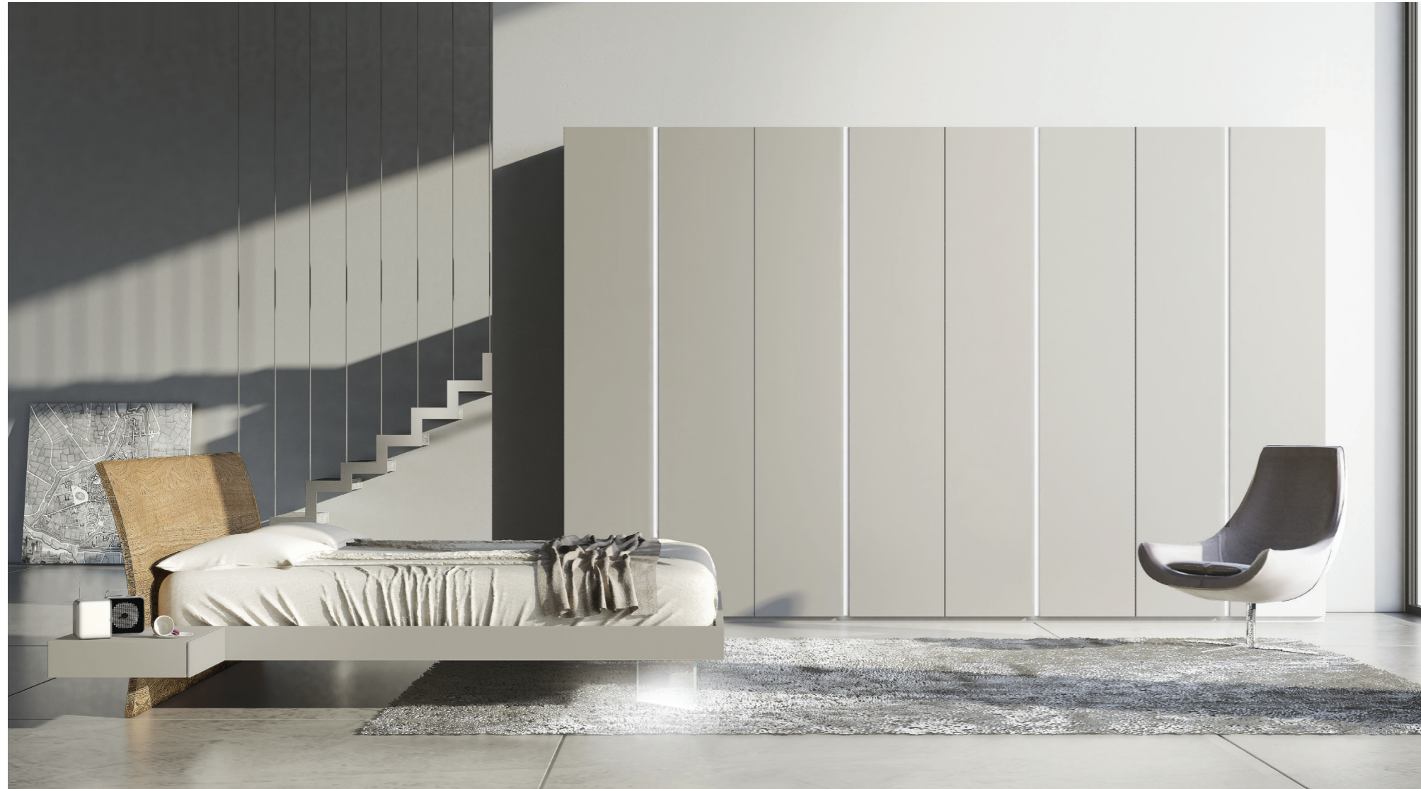
35,3 | Letto My Love: testiera quercia, giroletto e comodini sospesi laccato opaco grigio alpaca, piedi in vetro con kit luci.

Chic, versatile e riposante: il grigio è un classico intramontabile. Una volta relegato agli uffici, è diventato il protagonista dell'interior design: risalta le tinte tenui, attenua quelle accese ed è un'ottima alternativa all'imperante total white. Questo colore deriva dalla mescolanza tra il bianco e il nero: dall'armonia tra gli opposti scaturisce un'atmosfera che invita al relax, per un arredo luminoso di giorno e romantico alla sera.