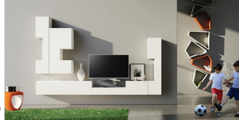
61,6| Parete cm 335,5x225h prof. 40 laccato opaco bianco .