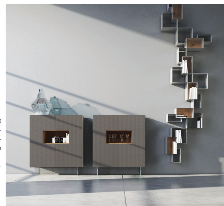
42,1| Madia 55-1 cm.120 H.140 P.40 Composta da 2 elementi sagomati 120x60 laccati opaco fango incisione 15 completi di teca 60x30 in quercia e piedi in vetro 3,5X6| Librerie young struttura grigio titanio, schiene quercia

La ricerca della luminosità attraverso finiture, materiali e originalità del layout compositivo. Una soluzione nel segno del bianco totale, che rende la luce protagonista dello spazio. Ante laccato gofrato bianco, elementi pensili in metallo.