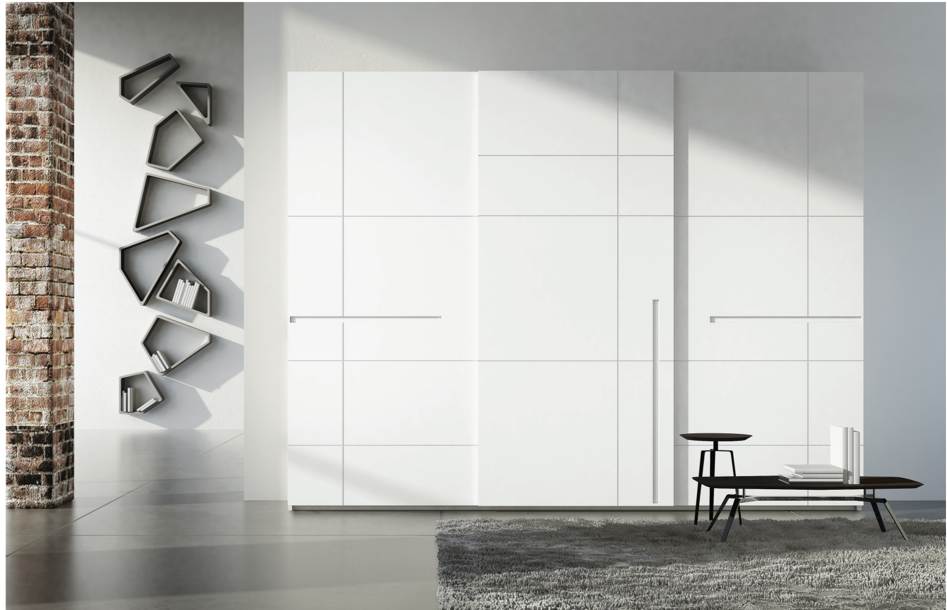
66,3 | Armadio Prestige cm 362,5 - 3 ante scorrevoli laccato opaco bianco.

Geometrie: l'uniformità del laccato bianco è scandita dal ritmo delle linee rette, per uno stile che seduce al di là delle mode.